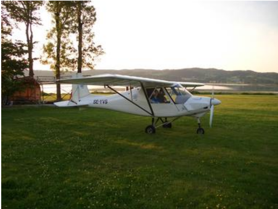
Fig 1. Ikarus C 42