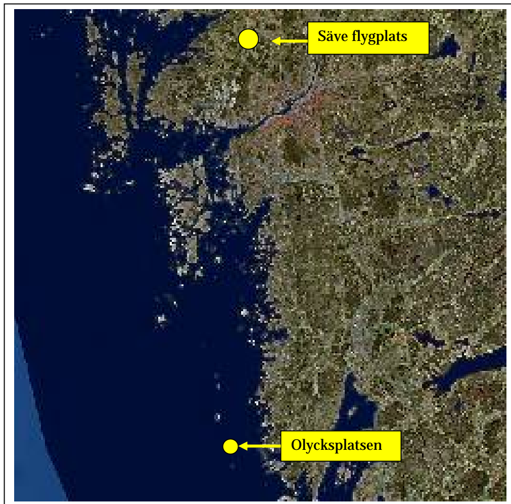
Fig.2 Olycksplatsen i havet utanför Onsalahalvön.